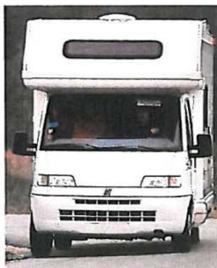
Virage avec KIT BLEU