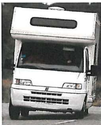
Virage sans KIT BLEU